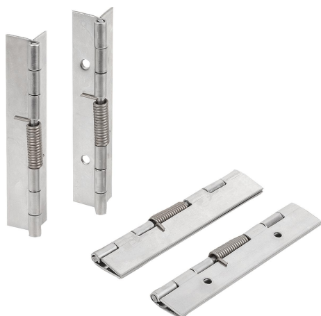
Шарниры с досылающей пружиной